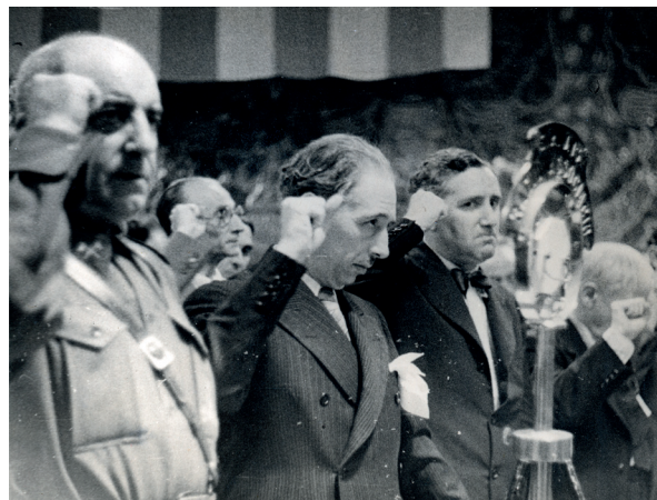
Sebastián Pozas, cap de l'exèrcit de l'est, Lluís Companys, president de la Generalitat de Catalunya, i Carles Pi i Sunyer, conseller de Cultura de la Generalitat, saluden amb el puny alçat durant el segon Congrés Internacional d'Intel·lectuals per a la Cultura. Palau de la Música Catalana, Barcelona, 11 de juliol de 1937.