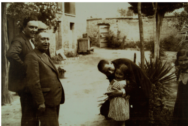
Lluís Companys, president de la Generalitat de Catalunya, saluda la neboda en arribar a la seva casa natal del Tarròs. Entre el mes de gener i d'octubre de 1934.

Refermat en el catalanisme, i davant la deriva conservadora del Govern republicà, el 6 d'octubre de 1934 Companys va proclamar l'Estat Català dins la República Federal Espanyola, per la qual cosa va ser empresonat. A les acaballes de la Guerra Civil, va emprendre el camí de l'exili, però a l'agost de 1940 va ser detingut per la Gestapo, que el va lliurar a les autoritats franquistes. Després d'un judici militar sumaríssim sense garanties processals, Companys va ser afusellat al castell de Montjuïc el 15 d'octubre de 1940. És l'únic president de govern elegit democràticament que ha estat executat a l'Estat espanyol.