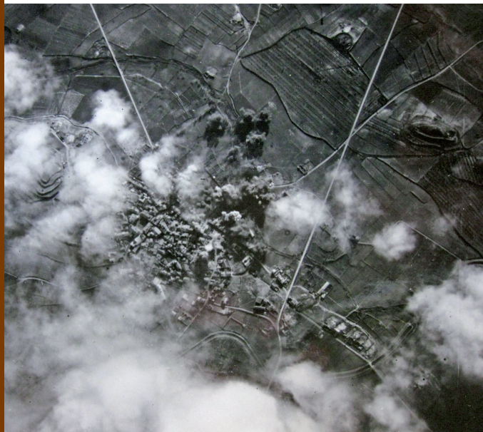
Bombardeig del dia 6 de gener de 1939 per part de l'aviació italiana. Van llençar 4.000 quilos de bombes des de 4.300 metres d'alçada.