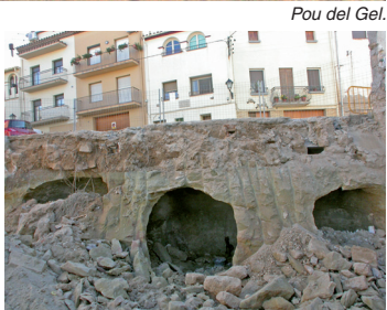
Pou del Gel.