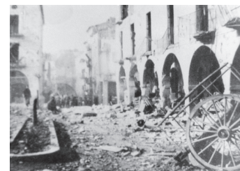
Edificis destruïts de la cara nord del Mercadal amb la runa encara al carrer.

La destrucció causada pels bombardejos als immobles va ser molt gran. El centre de la població va quedar molt afectat amb cases, corrals, magatzems i serveis de proveïment d'aigua, llum i clavegueram totalment destruïts. Avui en dia encara hi ha algun pati on no s'ha tornat a construir.