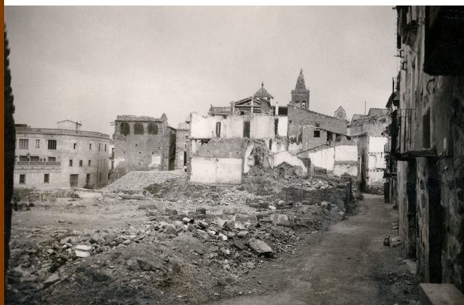
L'illa entre els carrers Castell i Carabassa de Dalt va quedar absolutament arrasada.

El primer va ser el més mortífer perquè la població no estava previnguda i les bombes van caure mentre els veïns mena-