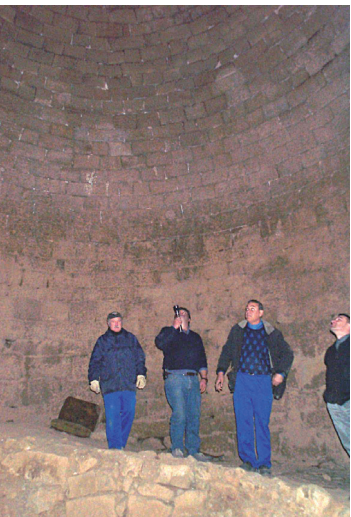
Refugi de transmissions.