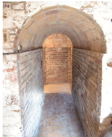
Refugi de transmissions.

A mitja alçada del turó del Castell es va construir un segon refugi públic, encara que molt més petit que el de l'església. Es va excavar directament a la roca argilosa i una gran llosa va servir de sostre sense que s'hagués de fer cap infraestructura.