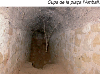
Refugi de l'aeròdrom dels Salats.