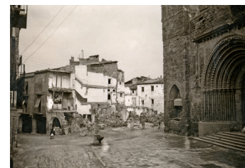
Gairebé tots els edificis al voltant de la plaça de l'Església van quedar totalment destruïts.

dies 23, 27, 30 i 31 de desembre de 1938. Durant la primera quinzena de gener del 1939 se'n van registrar un nombre indeterminat, però només se'n té constància documental dels atacs dels dies 6 i 12.