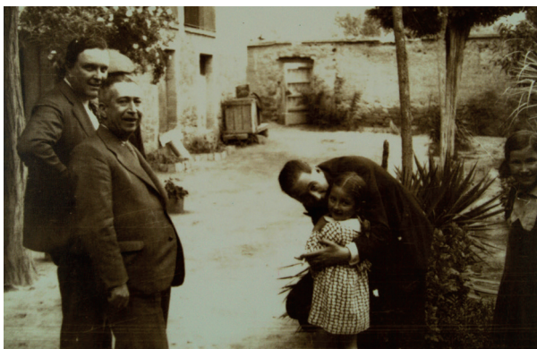
Lluís Companys, président de la Generalitat de Catalunya, salue sa nièce à son arrivée à sa maison natale d'El Tarròs. Entre janvier et octobre 1934.

Après un procès militaire très sommaire sans garanties procédurales, Companys fut fusillé au château de Montjuïc le 15 octobre 1940. Il s'agit du seul président de gouvernement élu démocratiquement à avoir été exécuté en Espagne.