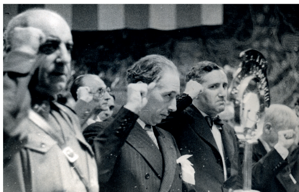
Sebastián Pozas, chef de l'armée de l'est, Lluís Companys, président de la Generalitat de Catalunya, et Carles Pi i Sunyer, ministre de la Culture de la Generalitat, saluent le poing levé lors du second Congrès international d'intellectuels pour la culture. Palais de la Musique Catalane, Barcelone, 11 juillet 1937.